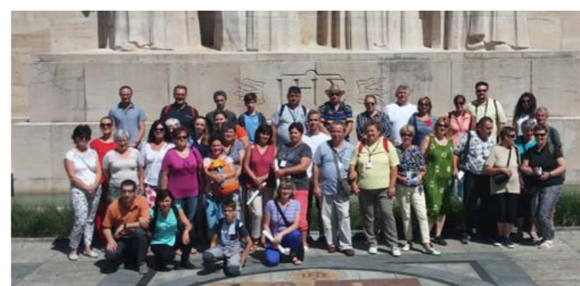
a Reformáció Emlékműve előtt Genfben

„Vezess Jézusunk, s Véled indulunk” – énekeltük a jól ismert dicséretet, amikor augusztus 19-én hajnalban kigördült autóbuszunk az Ihász utcából. Kálvin János nyomában indultunk gyülekezeti kirándulásra. A Reformáció 500. évfordulóját talán nem is lehetne méltóbb módon megünnepelni, mint azoknak a városoknak, helyeknek felkeresésével, ahol egykor reformátoraink munkálkodtak. Az első nap Nürnbergig utaztunk; az óváros megtekintése után wilhelmsdorfi szállásunkra tértünk. Másnap a mesés Rothenburg ob der Tauber volt első úticélunk, majd Heidelberg következett, ahol 1563-ban Ursinus Zakariás és Olevianus Gáspár megírták a Heidelbergi Kátét. A harmadik nap Basellal , az Institutio otthonával ismerkedtünk. Előbb egy külvárosi református templomban énekeltünk, imádkoztunk, majd a Baseli Münster és más nevezetességek következtek. A következő napot Genfben töltöttük városnézéssel és egy délutáni sétahajózással. Aug. 23-án a Genfi-tó partján utaztunk, először Evianban néztünk körül, majd Chillon vára és Zürich következett. Másnap Liechtenstein fővárosában, Vaduzban álltunk meg. Utolsó esti szállásunk az 1560 m magasan lévő Axamer Lizumban volt. Ritka pillanatait az ember életének azok, amikor az öröm, a szépség és a boldogság annyira koncentrációdik, hogy nem nehéz hálásnak lenni. Ilyen pillanatokot élhettünk át Isten kegyelméből utunk során. Végül Enns városát érintve lelkileg meggazdagodva, békében, egészségben érkeztünk haza. SDG!