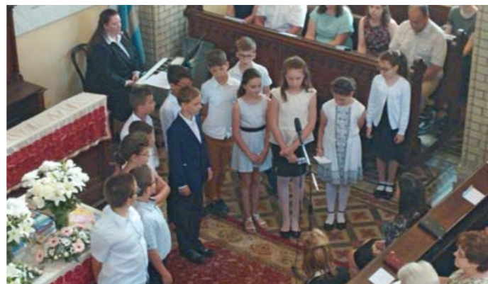
Június 11-én tartottuk a Tanévzáró istentiszteletünket. A képen a 4. osztályosok egy csoportja.