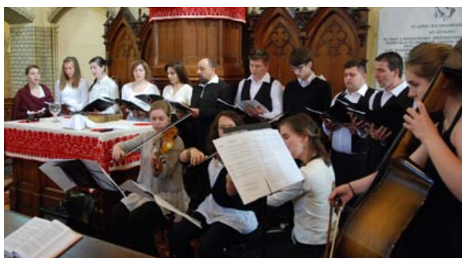
Május 22-én, a Református Egység Napján Csejdről (Marosvásárhely mellől) érkezett erdélyi fiatalok zenéltek istentiszteletünkön.