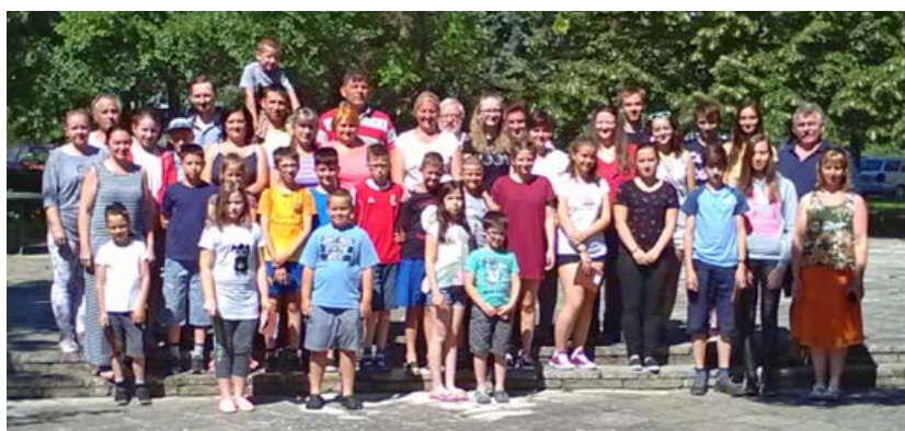
A balatonföldvári nyári bibliai táborunk heti témája mi más is lehetett volna, mint a Reformáció. Minden nap egy-egy bibliai történet által érthettük meg, mit jelent a mi életünkre nézve az 5 reformátori alaptétel: Egyedül a Szentírás, Egyedül kegyelemből, Egyedül hit által, Egyedül Krisztus és Egyedül Istené a dicsőség. Valóban Ővé a dicsőség a gyönyörűségéért!