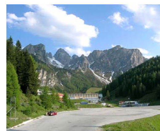
a svájci Alpok