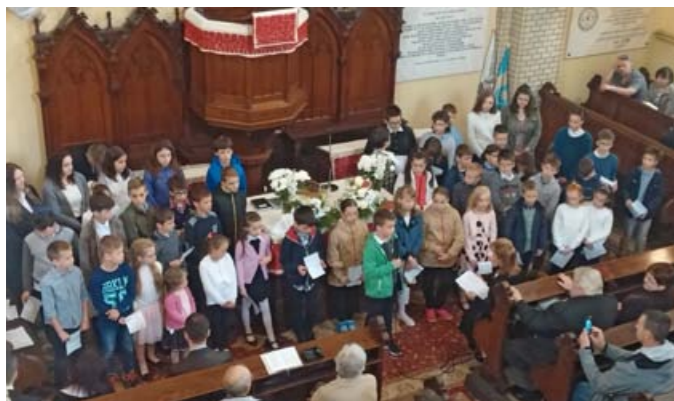
Anyák napján ének- és virágcsokorral köszöntötték a gyermekek édesanyjukat, nagymamájukat.