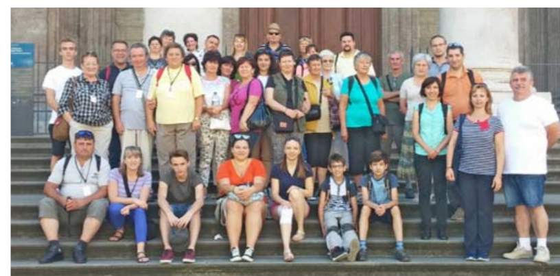
Genfben a Szent Péter templom előtt